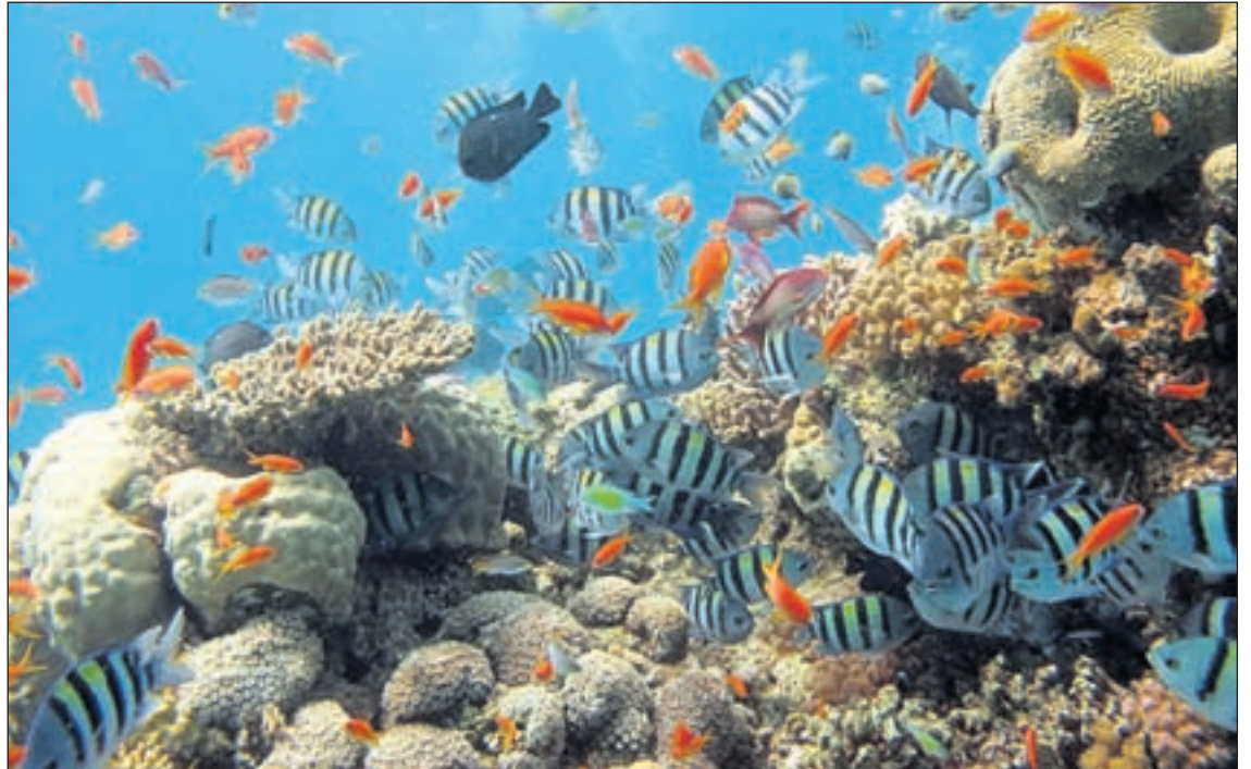
Biodiversidad ta parti di e funcion di e clima, esaki ta specialmente den areanan tropical manera Aruba.

ORANJESTAD – Biodiversidad ta e variacion grandi di diferente bida di especie, sistema ecologico y nos mundo henter. Biodiversidad ta mas bien e totalidad di diferente bida aki na mundo. Biodiversidad ta parti di e funcion di e clima, esaki ta specialmente den areanan tropical manera Aruba. Riba mundo tin diferente bidanan cu ya no ta